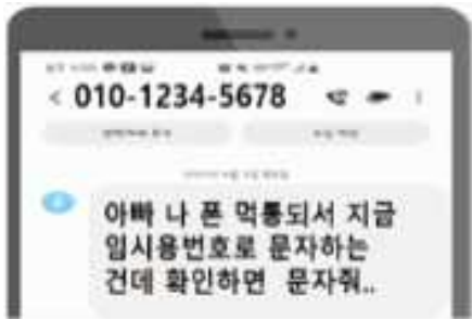
기존 해외 로밍 여부 판별 불가능